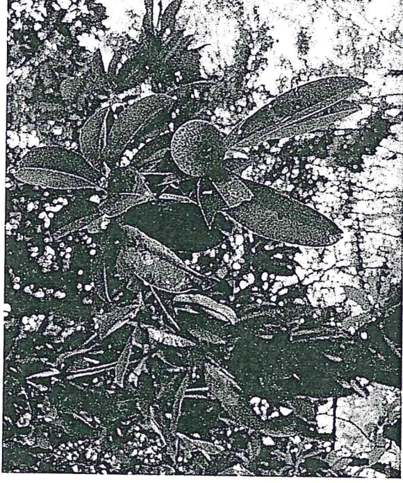
Fig.2; Observación de fructificación de especies de árboles

El informe contiene información sobre las observaciones realizadas a 14 especies arbóreas y una palma durante los meses de febrero y marzo. Estas observaciones iniciales servirán de base para el establecimiento de un plan de monitoreo de la fenología de especies del sitio arqueológico Yaxha.