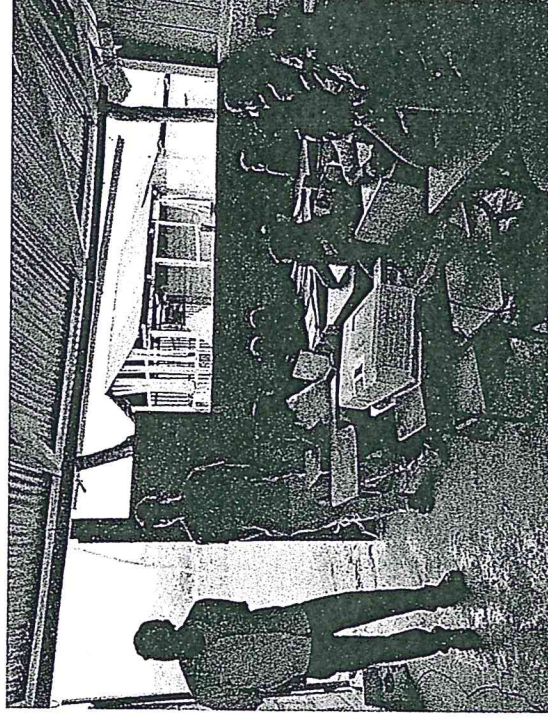
Fig.1: Actividad educativa con niños de escuela primaria.

La encuesta telefónica contiene preguntas generales sobre la comunidad estudiantil de las escuelas primarias y características de las escuelas como acceso a energía eléctrica, agua, presencia o ausencia de biblioteca estudiantil, etc.